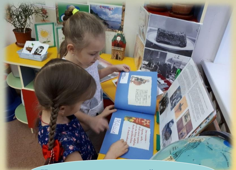
ЧТЕНИЕ ХУДОЖЕСТВЕННОЙ ЛИТЕРАТУРЫ