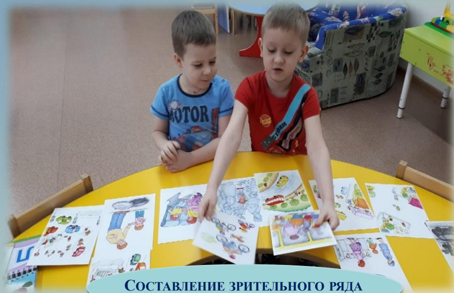
СОСТАВЛЕНИЕ ЗРИТЕЛЬНОГО РЯДА